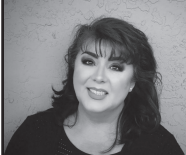
Realty World Golden Hills

Buy or Sell your home with me & Five Wounds Church will get 25% of my commission on your behalf.