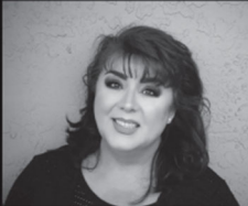
Realty World Golden Hills